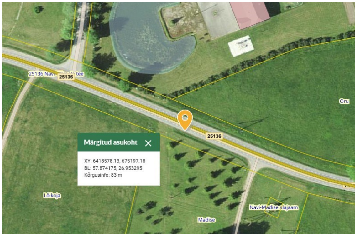
Joonis 2. Navi bussipeatuse uus asukoht riigitee 25136 km 1,32 (paremal)