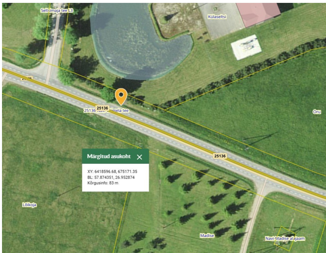
Joonis 1. Navi bussipeatuse uus asukoht riigitee 25136 km 1,29 (vasakul), väljavõte Maa- ja Ruumiameti geoportaalist