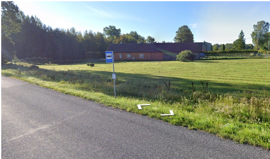
Joonis 4. Olemasolev Paidra põik bussipeatus riigitee 25241 ca km 3,206 (vasakul), tänavavaade seisuga august 2024

Me ei võta endale kohustusi seoses olemasolevate bussipeatuste ümbertõstmise ning uue bussipeatuse rajamisega, sh peatusetaskute, peenralaienduste, platvormide, istepinkide vms ehitamine. Vajadusel tuleb sellised tööd finantseerida kohalikul omavalitsusel.